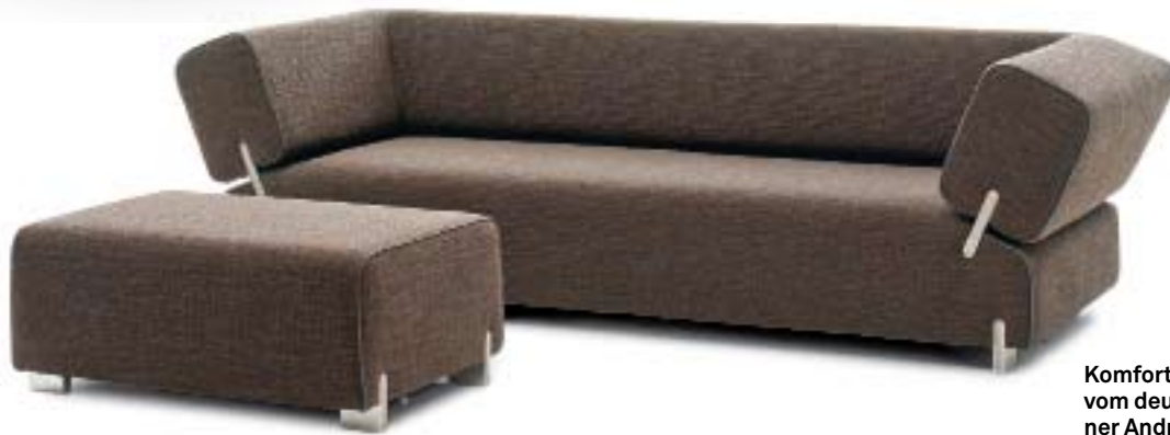
Komfort: «Collana» vom deutschen Designer Andreas Berlin für Leolux.

→ gedanklich in ihr Umfeld passen.» Ihm kommt es entgegen, dass der Hype um Design aus den Niederlanden für den Moment vorbei ist – was eine der ergänzenden Ausstellungen zur Biennale für Social Design schlüssig belegt –, sie nimmt mit klarem Verweis in die Vergangenheit Bezug auf die einstige Squatterzone in der gesamten Randstad (die miteinander verwachsenen Grossstädte Amsterdam und Rot-