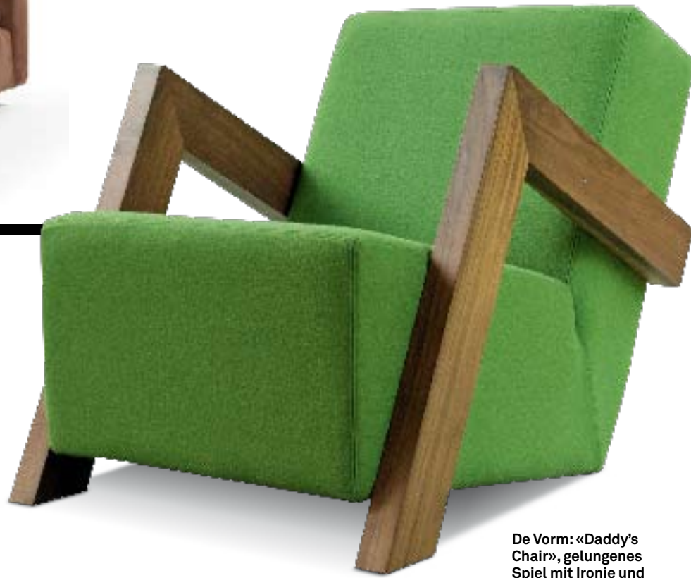
De Vorm: «Daddy's Chair», gelungenes Spiel mit Ironie und Komfort.