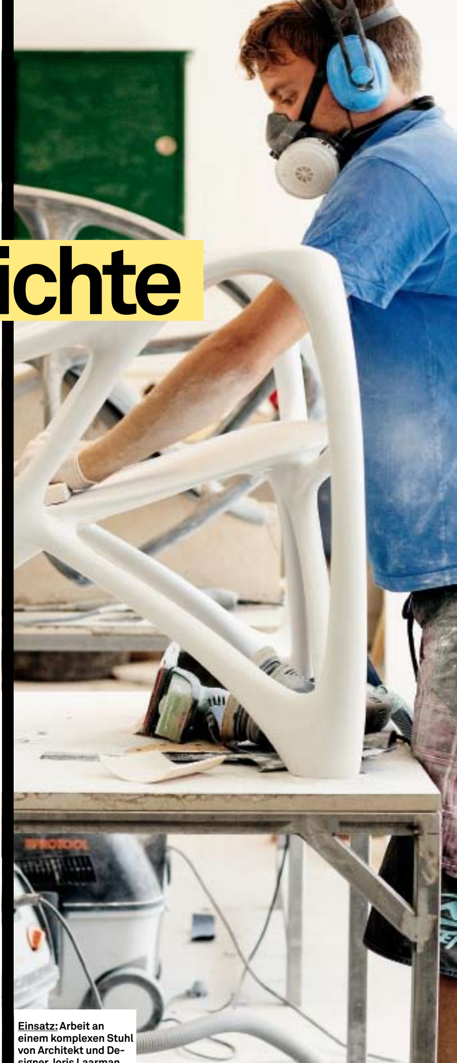
Einsatz: Arbeit an einem komplexen Stuhl von Architekt und Designer Joris Laarman.