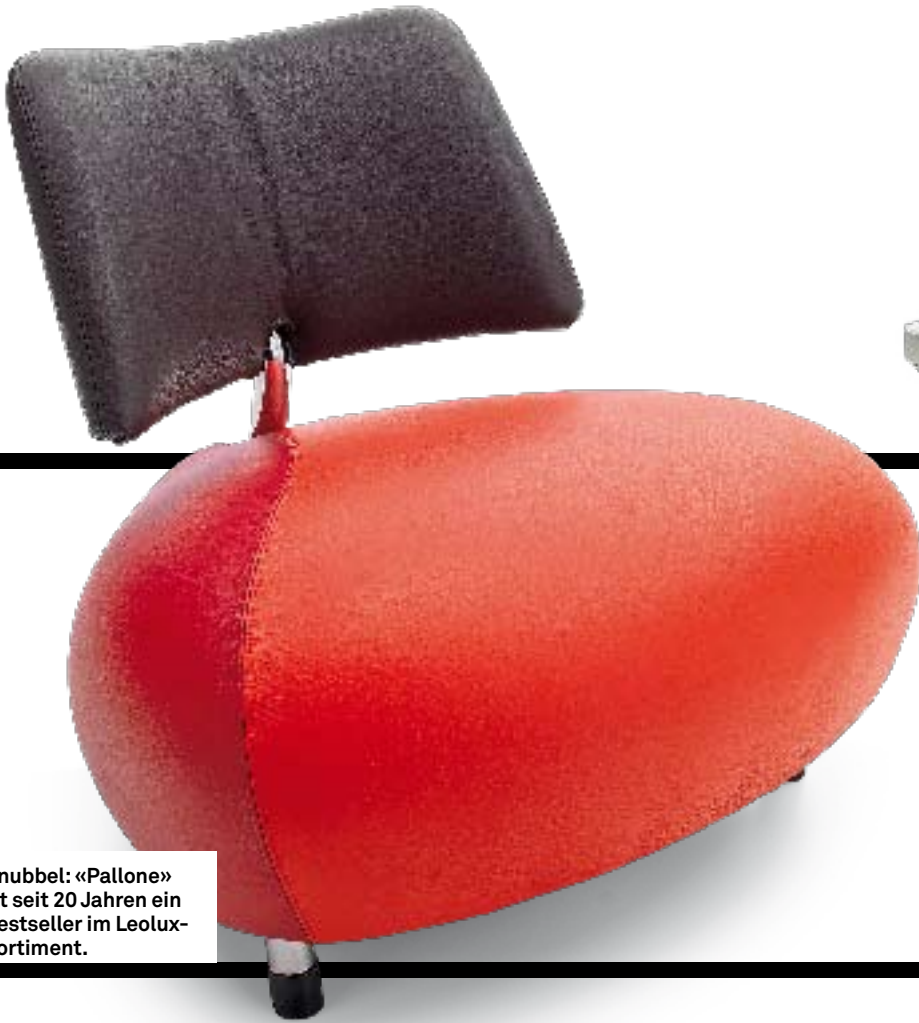
Knubbel: «Pallone» ist seit 20 Jahren ein Bestseller im Leolux-Sortiment.