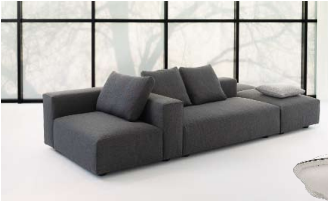
Montis: Elegantes Endlos-Sofa «Domino» von Dick Spierenburg.