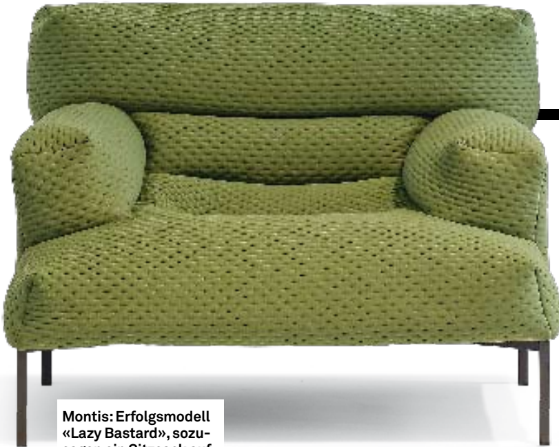
Montis: Erfolgsmodell «Lazy Bastard», sozusagen ein Sitzsack auf Beinen.

Z.B. Montis : Stimmungen zwischen Jugendlichkeit und cooler Konvention.