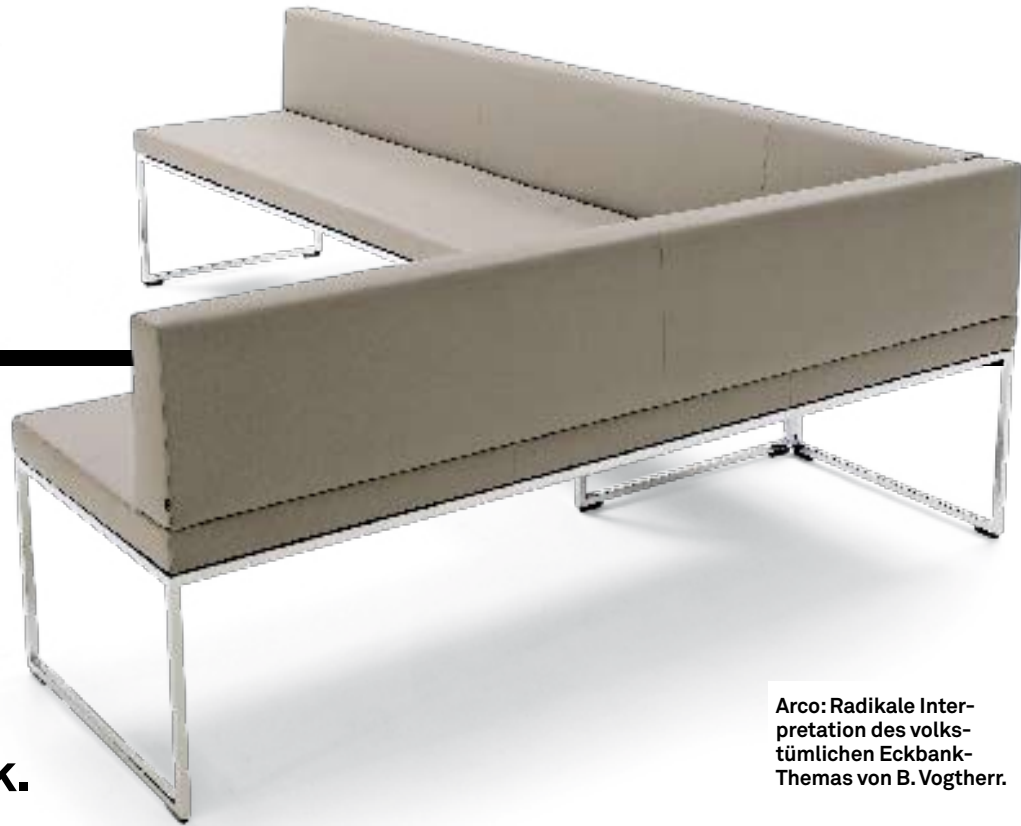
Arco: Radikale Interpretation des volkstümlichen Eckbank-Themas von B. Vogtherr.

Z.B. Pastoe und Arco : Zwei Labels mit der Lizenz für reinste Ästhetik.