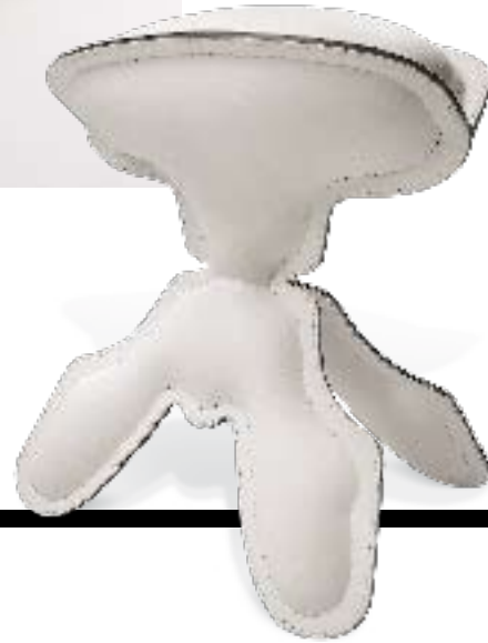
Montis: «Lost and found» von Demakersvan, hergestellt in Schuhmacher-Technik.